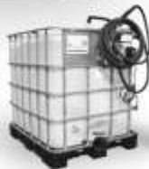
Uw AdBlue leverancier